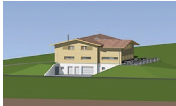
Fotomontagen der neuen Schirmhütte

Umgebung, Gaststube sowie WC-Anlagen werden baulich behindertengerecht gestaltet. Im Obergeschoss bietet eine Wohnung die nötigen Räumlichkeiten für die Wirtsleute. Das Gebäude soll sich gut in die Landschaft einfügen und in einer gefälligen Form daherkommen. Für Konstruktion und Fassade wird einheimisches Holz verwendet.