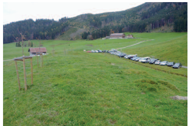
Aufnahme vom Standort Schirmhütte am 31. Oktober 2010

Das Hochplateau im Rufiberg (1050 m ü. M.) hat sich in den letzten Jahren zu einem sehr beliebten Ausflugsziel entwickelt. Wanderer, Biker, Gleitschirmflieger, aber auch Familien und ältere Personen sind zunehmend in diesem Naherholungsgebiet anzutreffen. In der weiteren Umgebung gibt es jedoch keine Verpflegungsmöglichkeiten und es fehlt ein öffentlich zugängliches WC. Die Unterallmeind Korporation Arth (UAK) möchte diesem Bedürfnis Rechnung tragen und beabsichtigt ein gediegenes Bergrestaurant zu erstellen. Zusätzlich erfährt der Rufiberg mit der Pflanzung von Allees und mit dem Bau eines Natur Weihers eine landschaftliche Aufwertung. Dieser Weiher dient gleichzeitig der Bereitstellung von genügend Löschwasser für den Raum Rufiberg.