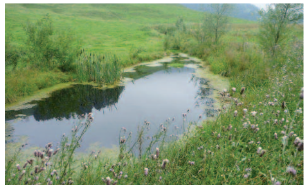
Ein schönes Beispiel, wie ein Naturweiher gestaltet werden kann