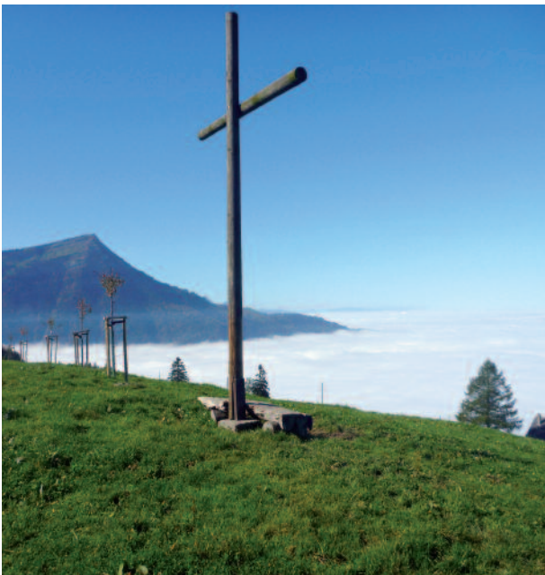
Aussicht in Richtung Rigi mit Nebelmeer über dem Zugersee